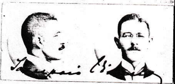
Retrato tirado em 19 de Abril de 1911